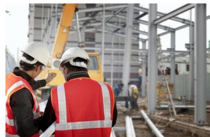
图1 监理人员实地考察

在建筑工程施工工作开始之前，需要工程监理人员对施工方面的的问题全面了解，并针对具体的施工情况制定相应的施工制度，在具体的施工过程中会涉及到施工设备的使用、施工人员的具体分配，就需要工程监理人员参与其中进行具体的分配，确保施工进度的顺利开展，根据施工制度进行具体的施工开展中，针对施工中存在的不合理的地方要及时指出并改进，进而确保建筑工程的施工顺利开展，(如图1)对于具体的施工人员进行施工技术的监督，保障在施工过程中施工技术的规范性，工程监理工作作为建筑工程质量的基础工作，在提升监理工作重视程度同时，将监理工作贯彻落实到建筑工程的实际施工过程中，在建筑工程施工开展之间，要观察施工企业得资质进行全面的审核，在确定施工企业拥有相应的施工能力之后，在进行施工的具体开展，监理单位要对施工企业的设计图纸、施工技术等方面进行全方位的检查，确保没有疑问之后进行具体施工地开展。