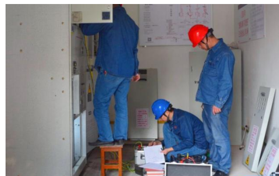
图二 电力工程安装工作

有些电力企业并没有足够的重视政工管理工作队伍的建设,因此,在领导分配工作的时候,很难在繁重的工作中将艰巨的工作做得很好,因此,迫切需要加强政工队伍的建设(如图二)。但是,大部分的工作人员都觉得,政工管理工作是由政工部门来负责的,与自己所从事的工作没有太大的联系,因此,在工作中,他们的态度也没有调整好,因此,政工管理工作的成效并不明显,政工管理队伍的建设状况与日薄西山。