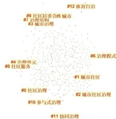
图 2 关键词聚类图

根据关键词聚类图谱(图 2)可以将中国城市社区治理研究领域的重点关键词分类为以下四个方面:一是对于城市社区治理总体的研究,关键词主要有:“城市社区”、“城市社区治理”、“城市治理”、“城市”;二是城市社区治理内容的研究,关键词主要是“社区建设”、“社区治理”、“体育自治”;三是对城市社区治理模式的研究,关键词有“参与式治理”、“协同治理”、“治理模式”;四对城市社区治理主体的研究,关键词主要是“社区居委会”。