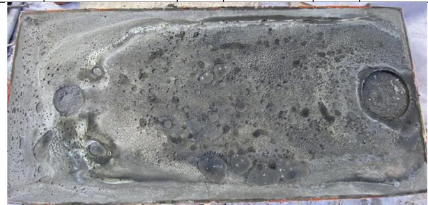
图 2 小尺寸试验板灌注效果图

从表 1 中可以看出“气泡不合格”问题非常突出，占全部质量问题的 75.0%，是影响自流平砂浆揭板试验合格率的症结所在，为此需将自流平砂浆揭板试验合格率提高到 85%。