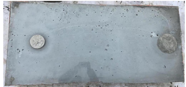
图3 重新灌注的小尺寸试验板效果图

再次灌注 50 块小尺寸试验板和 7 块四分之一足尺揭板, 灌注效果及质量合格率统计如下表: