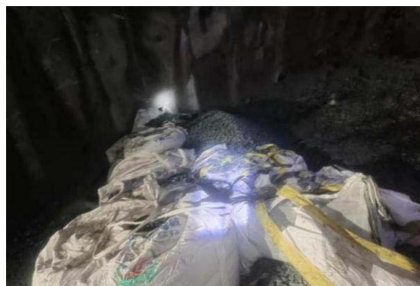
图3 反压及操作平台碎石吨袋堆码

(3) 反压施工平台:采用碎石吨袋堆码回填,兼具反压拱脚与施工平台功能,同时具有良好的透水性,保证稳定性的同时滤出塌腔及掌子面渗出的地下水(如图3)。