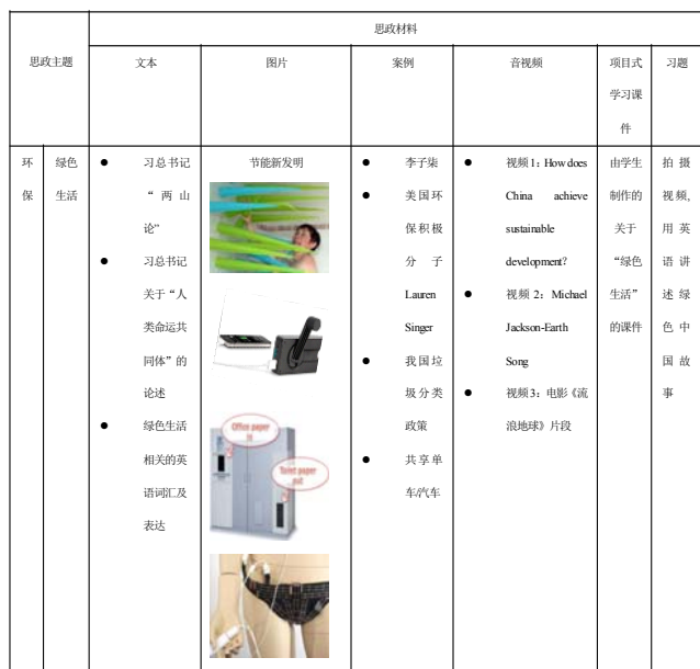
表6 英语课程学生思政学习资源库思政材料示例