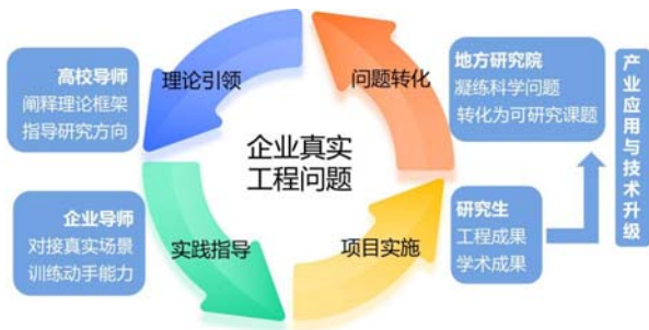
图2 以真实工程问题为驱动的项目载体培养路径示意图

生物质资源化团队还建立了定期交流与联合指导制度。具体做法包括: 每两周召开一次线上或线下的组会, 学生汇报近期进展和遇到的问题, 三方导师共同研讨、调整思路。在开题、中期考核和毕业答辩等重要节点, 邀请企业导师和研究院导师参与评审, 从实际应用角度提出意见建议。对于学生在企业实践中遇到的技术难题, 随时由研究院导师牵头, 组织企业导师与校内相关专家召开专项研讨会, 集中攻关。这种管理方式, 让学生身处异地既能享受相对宽松自主的科研环境, 又始终处于多维度的关注与指导之下——既避免了无人过问的散养, 也防止了多方面管理带来的冲突。