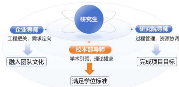
图3 “三位一体”指导与管理协同示意图