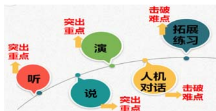
图1 实验组解决知识重难点方式示意图

通过听、说、演、人机对话和拓展练习多手段配合，解决本课知识重难点（见图1），以任务训练为主线的有效练习时间为25分钟以上（见表1），教学评价共4次，并贯穿课堂。评价一，在练一练环节的任务一中，请学生填写护士的预约就诊卡并拍照，发送至老师微信，师评并计入本堂课学生平时成绩；评价二，在练一练环节的任务二和任务三中，请学生表演英文对话，学生互评。评价三，在练一练环节的任务五中，请学生为护士配音，学生互评。评价四，人机口语对话，智能口语软件打分，评价更为客观。