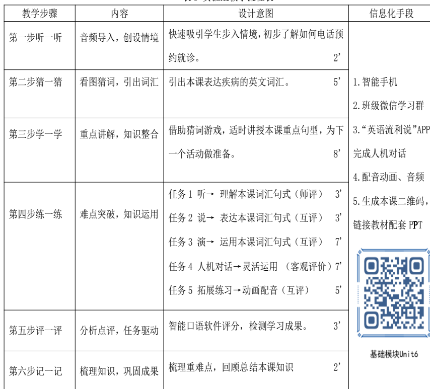
表1 实验组教学流程图

第三步,学一学,知识整合,重点讲解。结合猜词游戏,笔者适时讲授本课描述病情的英文重点句式,通过讲解,学生掌握重点知识,为下一个练习活动做准备;