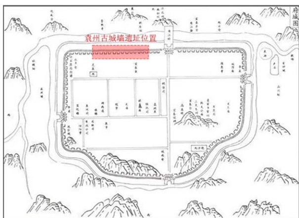
图1 明正德九年袁州府城图

宜春市袁州区古城墙的历史可追溯至西汉时期。袁州城始建于汉高祖六年,为宜春县治,初为夯土城。唐代起城池逐步拓展,李大亮凿壕筑城,房琯扩西南、移重心,李将顺修李渠以完善功能。南唐刘仁贍以砖石筑罗城并建雉楼。宋代在军事压力下加固城防,始有城门记载 [4] 。明清时期频繁修葺,系统构建城楼、月城与马道,形成规整格局(见图1),清代更增城门、改题额,城池形制趋于完备 [5] 。