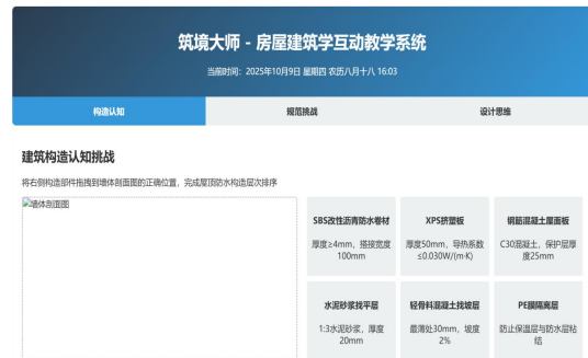
图 2 互动教学实操模块

借助筑境大师-房屋建筑学互动教学系统(如图 2 所示),完成建筑构造认知、规范挑战、设计思维等模拟操作,同时模拟不同施工工况(如恶劣天气、设备故障)下的施工调整方案,开展施工进度与质量的智能管控分析,显著提高学生对建筑构造的掌握能力和工程应急处理能力。