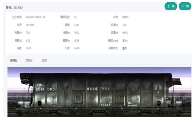
图1 铁路货运智能监测系统监测的车辆信息

根据货车车辆的性能以及铁路线路特点等,把超偏载分为一般和严重两个级别,作为是否需要处理的依据。