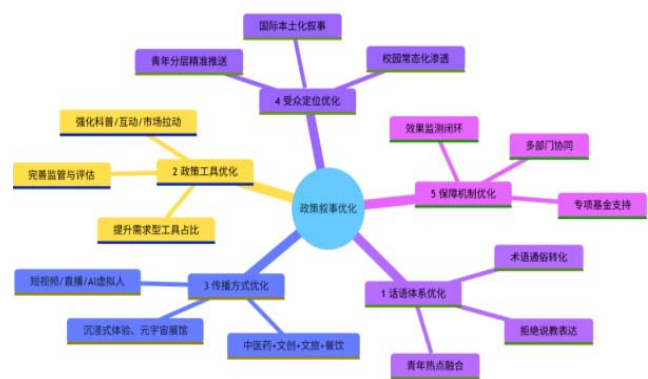
图2 政策叙事优化体系