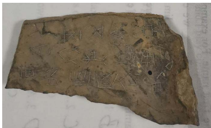
图为广西平果出土的甘桑石刻文

平果甘桑石刻文是由感桑村的当地村民在耕田种地时在一片田间不经意间发现的，它的发现引起了轰动，震惊了学术界。自2006年发现以来，途经几次考古挖掘以及地表采集，出土并收集整理了2万多个字符。根据碳定年法测定，甘桑石刻文已有3600多年的历史，目前还一直处在研究阶段。2019年7月10日召开了平果市甘桑石刻文学术研讨会暨阶段性成果展示会，共同研讨了甘桑石刻文，并进一步取得了新的进展和突破。百色学院李志强教授历经六载，反复研究，与相关专家学者共同研究，坚持不懈，攻坚克难，最终出版了《平果县甘桑石刻文图像叙事摹本及字符集》一书。中央民族大学壮侗研究所研究员黄懿陆教授对甘桑石刻文的研究有了新的发现，在他的《骆越史》《甘桑石刻文新资料汇编》等著作中，他认为甘桑石刻文记载了商纣王突围南迁建国的重大历史事件。这些成果对于研究和解密甘桑石刻文之谜有重大意义。