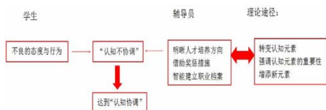
图一 “认知协调”的教育模式

基于费斯廷格“认知不协调”理论对德育工作的理论和现实的指导, 辅导员当面对学生不良态度或行为时, 能准确掌握学生“认知不协调”状况, 并懂得采取相应的方法和手段, 最终达到“认知协调”的理想教育模式。