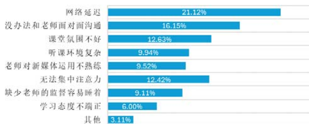
图2 学生认为线上教学存在的问题占比

(2)教学设施不完善:线上教学普及导致平台用户激增,高峰时段常出现服务器崩溃、登录困难、卡顿、网络延迟等现象,影响听课体验。在此次问卷调查中,关于“学生认为线上教学存在的问题”的调查结果如图2所示,其中有21.12%的学生认为最大的问题是网络延迟。另外,数据传输失真也会对教学质量造成一定影响 [3] 。音乐、美术等课程对音画要求高,硬件或网络问题导致的数据失真,会降低学习效果。此外,部分学生仅用手机学习,小屏幕不仅伤眼,还可能影响课件与板书查看。