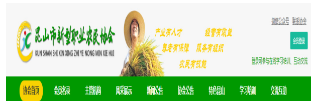
图3 昆山市新型职业农民协会官网

提升自己的技术能力。在网站右上角，你可以通过关注微信公众号的方式更方便的了解昆山市新型职业农民协会的发展动态。