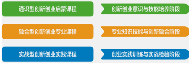
图2 学院三级联动的双创教育体系

创新创业教育课程体系;以双创必修课为核心,线上双创类公选课及双创讲座为通识型双创启蒙课程,着重学生创新创业意识的培养;以《综合课程设计》、《智能电子产品设计与制作》等专业教育与创新创业教育融合型课程,着重学生专业知识技能与创新创业的融合,提升学生的双创能力;以创新创业训练营、syb等创业培训为主的实战型双创实践课程,重在创业实践训练与实战检验(如图2)。