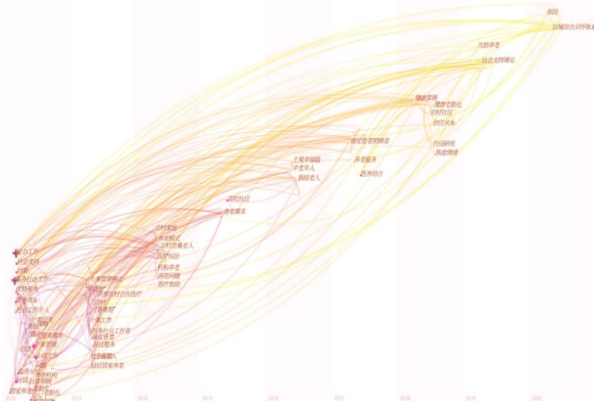
图3 关键词突显与 Timezone View 图谱

筛选参数g-index, k=25。得Nodes=323, Links=660。共出现6个突显词,强度最大的为医患关系,出现在2012-2014年,2012-2015年出现老年人和空巢老人,2015-2017年医务社会工作者突显。从这9年来探索的医务社会工作中的热门主题词及时间轴时间序列的分布可以看出研究方向及转变,医患关系最初介入,但研究始终围绕老年人医养问题,如图3所示。