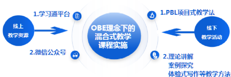
图6 OBE理念下的混合式教学实施图

践为需求,制定个性化学习目标;以人才培养目标为宗旨,确定教学内容;以成果为导向,构建混合式教学模式;以能力为本位,构建多元化学习评价体系。OBE教育理念使得教师组织教学活动成为一种自觉行为,有效解决了以往应用写作教学目标有效性不高、教学内容应用性不强、教学方法激趣性不够、教学评价流于形式等痛点问题。通过教学,师生都获得了学习能力、学习兴趣、学习成绩、教师水平、平台建设、实践能力和育人成效等方面的提升。