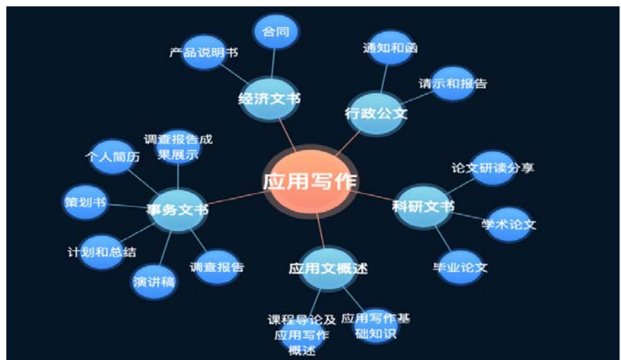
图3 “应用写作”教学内容

等方式提高学生的学习主动性，优化考核评价体系，增大平时考核比例，以提高学生的学习效果，真正达到提高教学质量、培养高质量应用型人才的要求。