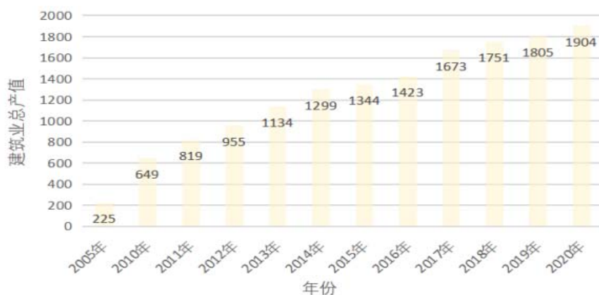
图2 盐城建筑业总产值(亿元)

步于20世纪80年代。凭借一股干劲和巧劲,盐城建筑业走出市域、走向全国,逐渐成为富民强市的支柱产业。目前,盐城正处于城镇化和工业化加速期,以农民群众住房改善为主的乡村振兴,以棚户区改造和老旧小区整治为主的城市更新,以及高铁、港口等重大基础设施的加快推进,这既是建筑业发展的“黄金机遇期”,也是建筑业转型升级的“战略机遇期”。